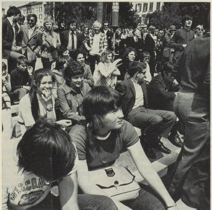
Les électrices entrent dans l'arène politique. A Glaris les places entourant l'estrade du gouvernement sont réservées aux écoliers qui font ainsi très tôt l'apprentissage de la vie politique.

Les « Landsgemeinde » ont lieu chaque année au printemps. Le dernier dimanche d'avril à Sarnen (Obwald), Stans (Nidwald), Appenzell (Rhodes-Intérieures), Trogen, les années paires et Hundwil, les années impaires (Rhodes-Extérieures) et le premier dimanche de mai à Glaris.