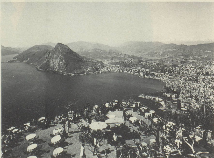
Vue sur Lugano et le Mont San Salvatore depuis le Monte Brè

— Et si vous acceptez mes conditions, je suis disposé à commencer le 1 er mars 1998...!