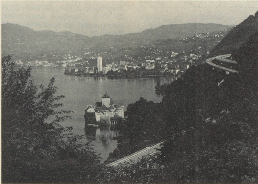
Vue sur le château de Chillon.