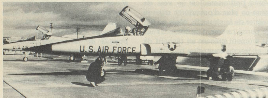
Le F-5 E Tiger II.

Un accord de collaboration est signé à Berne entre l'Office suisse d'expansion commerciale et la Chambre pour le commerce et l'industrie d'URSS.