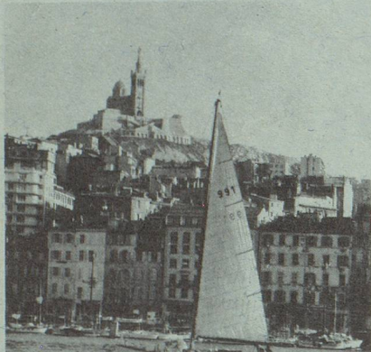
7, rue d'Arcole. Tél. : 53-36-65.