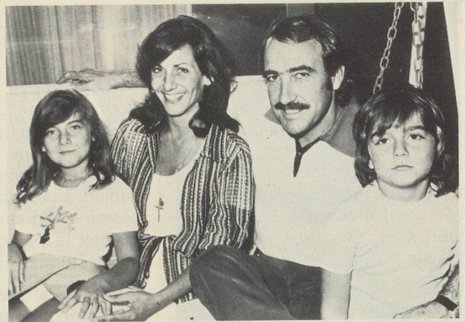
... entouré de sa famille