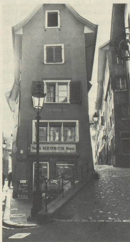
Dans le vieux quartier de Baden (ONST Zurich)

prenons volontiers la partie pour le tout. Nous avons toute liberté d'action, même la liberté de renoncer. Et c'est suffisant. C'est de là que vient peut-être aussi notre retenue, la mélancolie en toile de fond de notre caractère, qui s'exprime dans chaque acte de création, que ce soit un poème, un tableau ou un morceau de musique.