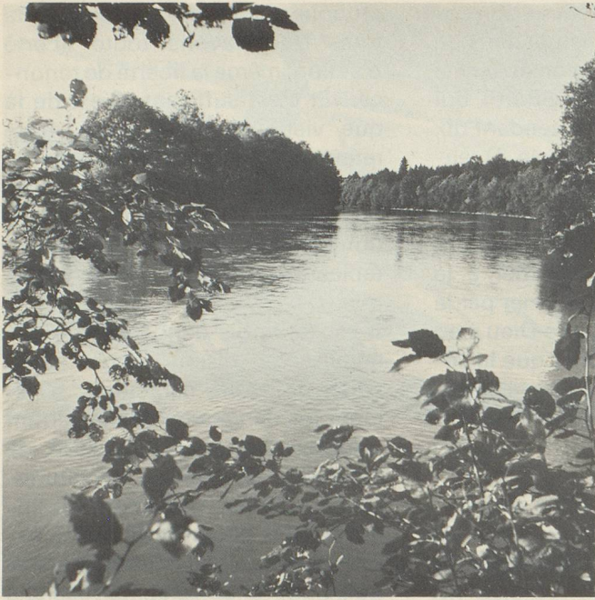
La «Reuss» près de Unterlunkofen