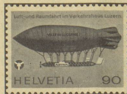
La navigation aérienne et spatiale au Musée des transports, Lucerne

Veuillez m'envoyer votre brochure-programme en (langue désirée)