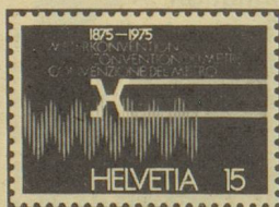
Centenaire de la convention internationale du mètre