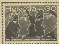
Année de la femme