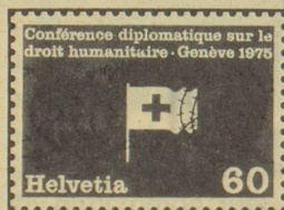
Conférence diplomatique sur le droit humanitaire