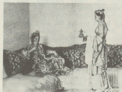
Liotard Jean-Etienne (1702-1789) Femme turque et son esclave (1738-1742) 21 x 29. Craie rouge et noire. Win- terthur, fondation Oswar Reinhart.