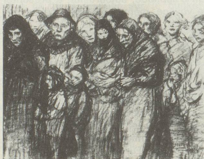
Th. A. Steinlen (1855-1923). Scène de rue 49 x 64,5 (fusain) Genève. Musée d'art et d'Histoire.