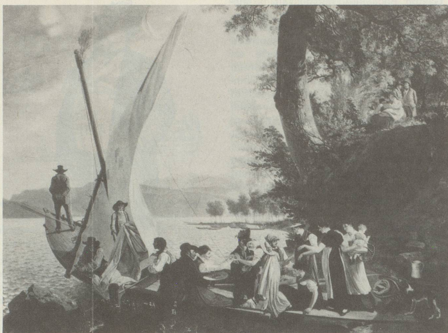
Wolfgang-Adam Toepffer (1766-1847). L'embarquement de la noce. 1814. Genève, Musée d'Art et d'Histoire.