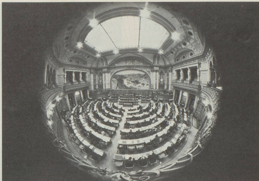
Le Conseil national

● 2 radicaux , le Zurichois Ernst Brugger (entré en 1969) et le Vaudois Georges-André Chevallaz (entré en 1973).