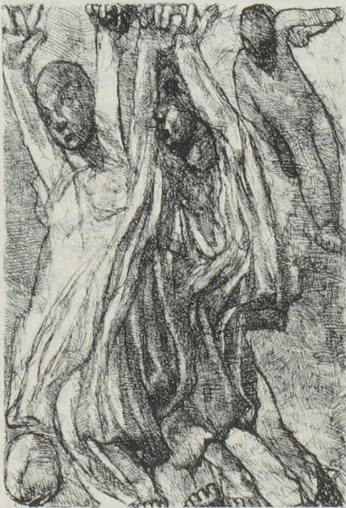
Louis SOUTTER L'Annonciation du Mal aux deux Anges (Cat. 101) Fondation Le Corbusier, Paris

Par un curieux hasard, un autre peintre romand, neuchâtelois et vivant celui-là, également expressionniste et en marge de toute raison cartésienne également, expose à Paris au même moment. Aimé MONTANDON est une sorte d'écorché vif qui hurle devant toute injustice, celle des ethnies sacrifiées entre autres. Cela se traduit picturalement par une imagerie puisée aux sources de la taumachie, aux folklores sud-américains et aux thèmes chers à CALLOT, GOYA et au PICASSO de GUERNICA : guerres et massacres ; tout cela traité dans un climat sado-masochiste exacerbé. La sincérité de l'artiste est évidente, ses fantasmes ni ses obsessions ne peuvent laisser indifférents mais peut-être