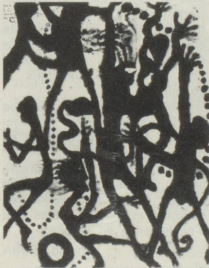
Louis SOUTTER Escale aérienne des pénitents Musée Cantonal des Beaux-Arts Lausanne (Cat. 187).