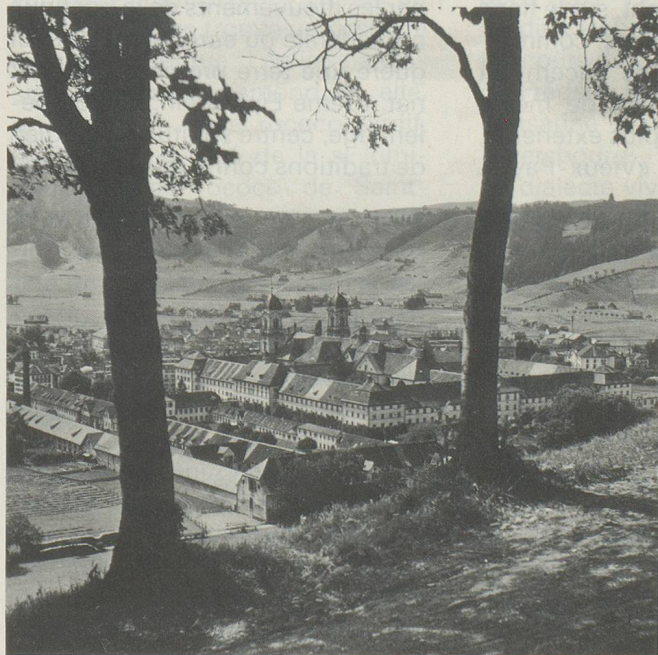
Vue du couvent bénédictin d'Einsiedeln, construit en 1720–1726 par Caspar Mossbrugger (ONST)