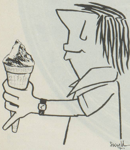
«Swiss ice cream»