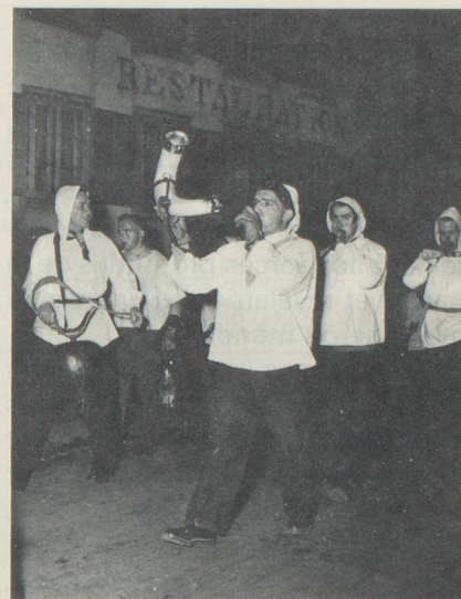
«Klausjagen», une vieille coutume de la Saint-Nicolas à Küssnacht