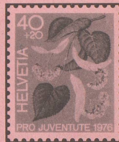
Linde Tilleul Tiglio