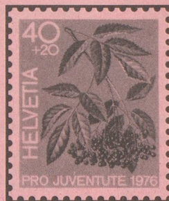
Schwarzer Holunder Sureau noir Sambuco