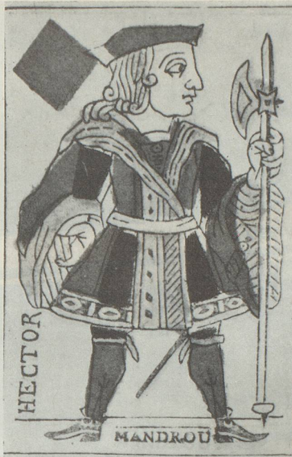
Carte à jouer de J.-J. Rousseau, tirée de la Revue neuchâteloise n° 51

Le jass est vraiment un jeu national dont les règles subissent de nombreuses interprétations locales. Naguère, les cafés affichaient un règlement anonyme parfois approuvé par une société cantonale de cafetiers, dans un endroit mal éclairé, difficilement accessible. Les jasseurs qui ont lu ces règlements sont une infime minorité, d'où cette floraison d'interprétations locales. Il existe de nombreuses conventions qui servent d'ententes entre partenaires, non enregistrées dans un règlement, quoique parfaitement correctes.