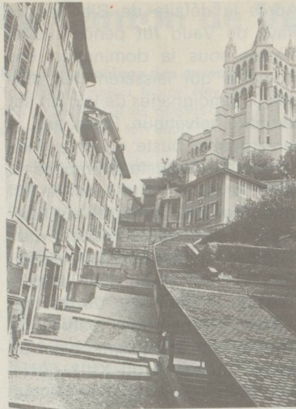
Lausanne – les escaliers du marché datant du Moyen-Age