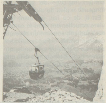
Vue sur le massif des Diablerets

Le Vaudois dit souvent, en parlant de son épouse, «la bourgeoise» et prouve par là qu'il la prend au sérieux en sa qualité de citoyenne. Le Pays de Vaud a été l'un des premiers cantons à accorder le droit de vote aux femmes et, sous la présidence de l'avocate vaudoise Antoinette Quinche, le mouvement féminin a permis l'obtention de nombreux droits politiques sur le plan fédéral.