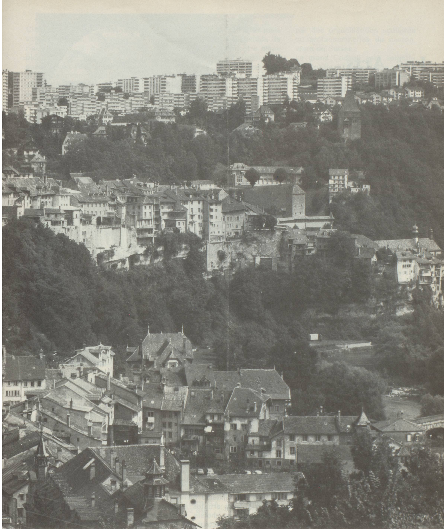
Coexistence de l'ancien et du moderne à Fribourg-ville. Comme dans une estampe japonaise, s'étagent la Neuve-ville, le Bourg et le Stalden, le Schoenberg : trois étages d'une même ville.