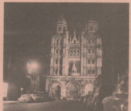
6, rue Rameau Tél. : 32-12-59