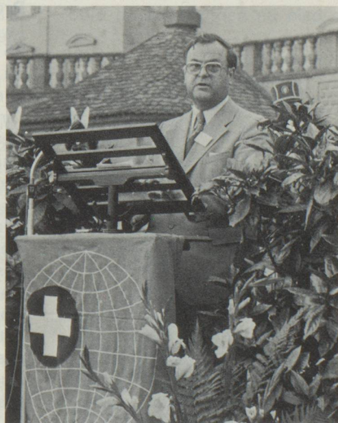
Le nouveau Président de l'Organisation des Suisses de l'étranger, Monsieur Alfred Weber, Conseiller national, lors du 56 e Congrès des Suisses de l'étranger, tenu à Einsiedeln.