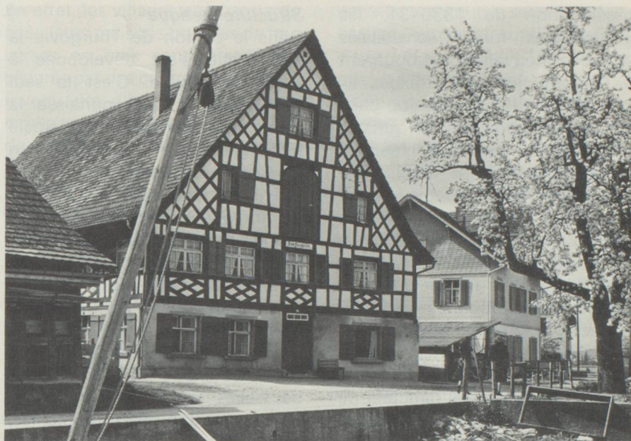
Maison à colombage à Ermatingen

Dans cette région on retrouve des vestiges de civilisation humaine datant de 2800 avant J.-C. A l'âge de la pierre on trouve des villages près du lac d'Egel, non loin de Niederwil et Breitenloo à l'ouest de Pfyn, dont la culture était semblable. Durant le néolithique on s'adonnait à la culture et à l'élevage, ce qui attira bon nombre d'émigrants en diverses vagues importantes. Ainsi vers 1800 avant J.-C. les potiers, puis les marchands d'objets en bronze firent leur apparition en provenance du sud, les Celtes par le nord. Puis durant 400 ans, la région fit partie de l'empire romain sans avoir à en souffrir, bien au contraire, car ils apportèrent leur connaissance, leur architecture, tout en développant la culture fruitière et la vigne. C'est durant cette période qu'un réseau routier fut mis en place pour des besoins commerciaux et militaires qui permit de relier les places de Arbor Felix (Arbon), Ad fines (Pfyn) et Tasgetium (Eschenz) au réseau du plateau suisse. Les Romains établirent plusieurs villes-garnison. L'invasion des Alamans fut brutale, ils imposèrent au pays leur langue, leurs us et coutumes ainsi que leur architecture. La caste des francs, connue sous le nom de Gau prit place sur près d'un quart de la Suisse actuelle et c'est à cette époque que l'on entendit parler pour la première fois de Thur-Gau dont on retrouve des traces dans une franchise saint-galloise de 744. Devenu un duché dans la répartition géographique qui suivit, il s'ins-