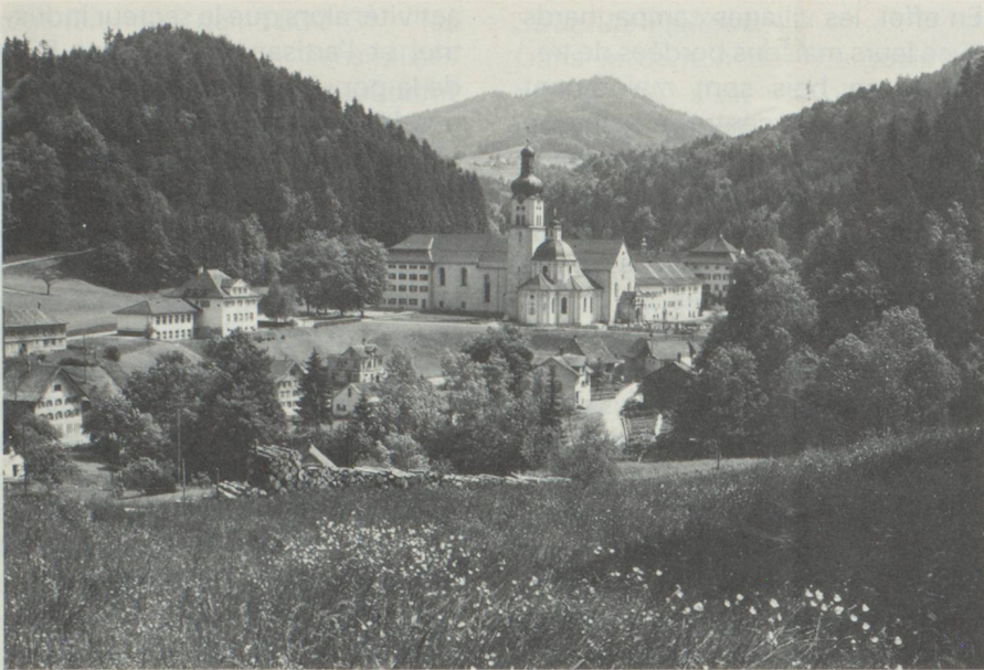
Abbaye des Bénédictins et église baroque à Fischingen

disséminées dans la vallée de la Thur, il convient de citer des meuneries importantes, des fabriques de carton et de machines sans omettre de signaler une entreprise de dimensions internationales vouant son activité aux produits oléagineux. Dans l'arrière-pays du sud, aujourd'hui fortement industrialisé, l'on trouve des fabriques de textiles, de meubles, de l'industrie métallurgique (parasols, stores, aménagements de cuisine) ainsi que de l'industrie chimique. En bref, une palette haute en couleurs.