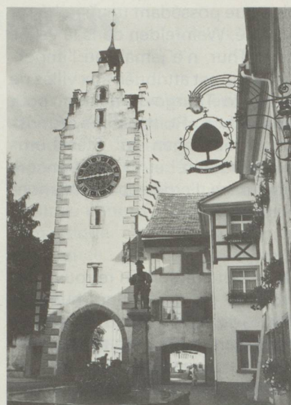
Tour de l'horloge ou du sceau construite en 1545 à Diessenhofen

Dans le canton de Thurgovie la démocratie s'est développée à partir du peuple. C'est le seul canton suisse qui connaisse la forme de la « commune municipale helvétique » et a conservé un dualisme communal qui mérite de retenir l'attention. En bref, cela signifie que les tâches de la commune politique sont réparties, depuis la création du canton en 1803, en 2 secteurs. On trouve des communes de lieu dont plusieurs de ces dernières forment la commune municipale. Chacune de ces dernières a une fonction double, car elles sont indépendantes, règlent leurs propres problèmes, tout en étant partie intégrante et administrative du canton (spécialement les plus grandes communes, soit les communes municipales). Il en résulte une répartition très vaste des postes politiques, d'où l'engagement d'un grand nombre de citoyens pour les remplir, avec en corollaire un droit de participation et de responsabilité étendu à beaucoup de personnes. En outre, le département de l'instruction publique a créé des communes de surveillance, puis il fut mis sur pied des communes religieuses pour chacune des 2 confessions importantes qui ont des pouvoirs en marge des problèmes dogmatiques. On trouve en outre des communes bourgeoises et