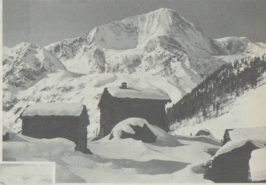
Pramousse s/Arolla. ▶