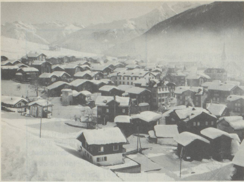
◀ Vue sur le village valaisan de Münster, vallée de Conches/Valais.