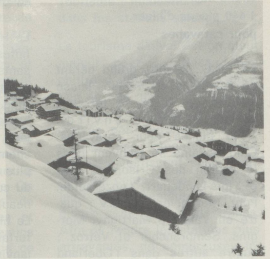
▲ A Bettmeralp au-dessus de la vallée du Rhône, venez découvrir l'agrément et la joie de vacances libérées du bruit et de l'agitation de la vie citadine/Valais.