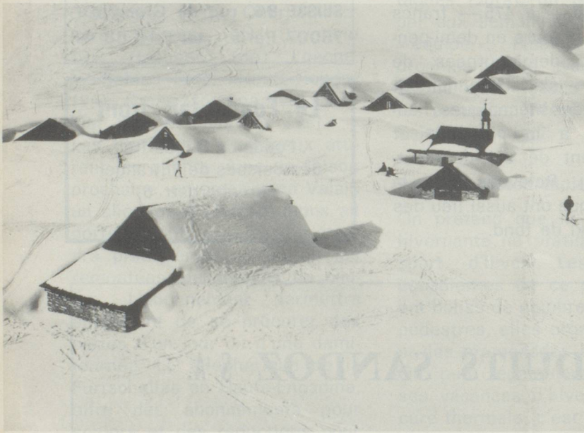
◀ Vue de l'Alpe de Feld depuis le téléphérique Lungern-Schönbüel/Suisse centrale.