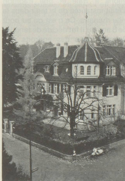
Siège du Secrétariat des Suisses de l'étranger

besoin d'un bureau faisant fonction d'organe exécutif et de liaison. On mit sur pied à cet effet en 1919 le Secrétariat des Suisses de l'étranger de la NSH, qui se révéla bientôt un instrument nécessaire et efficace. Son utilité apparut notamment lorsque les premiers Suisses chassés de la Russie en révolution affluèrent vers nos frontières et qu'il fallut pourvoir à leur réinstallation.