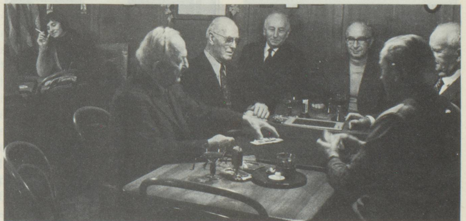
Une partie de Jass

L' Institut tropical suisse à Bâle ne manque pas d'intérêt pour les Suisses de l'étranger. Les émigrants peuvent y trouver informations et documentation. Une clinique spécialisée – qui n'est pas gratuite – lui est adjointe, elle peut donner des soins aux Suisses rapatriés souffrant de maladies tropicales.