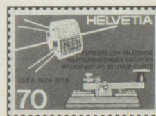
70 c. Cinquantième de l'Union des amateurs suisses d'ondes courtes