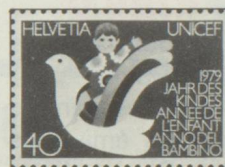
40 c. Année internationale de l'enfant