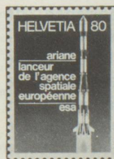
80 c. Agence spatiale européenne ESA