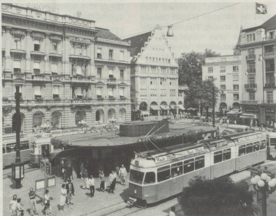
PARADEPLATZ — Le long de la Bahnhofstrasse Est le centre des affaires.

Autrefois marché de bétail, puis champ d'exercice, la fameuse Paradeplatz est déjà plus expressive. L'ancien arsenal a été transformé depuis lors en restaurant et, à l'endroit même où l'on alignait les bovins, au XVIII e siècle, paradent aujourd'hui les interminables trams bleus de Zurich, mille-pattes sur roues qui avalent majestueusement les rails quadrillant la zone piétonnière. Cette place un peu froide, encore dépouillée de verdure, dispose néanmoins de quelques ornements dignes d'être vus. Telle la bâtisse du Crédit Suisse, l'un des trois géants bancaires helvétiques (l'un des deux autres, la Société de Banque suisse, construction plus moderne, flanque aussi la place). Sans doute l'ancien hôtel Baur-en-Ville a-t-il plus de cachet, encore qu'il s'agisse en fait d'un immeuble qui a été entièrement