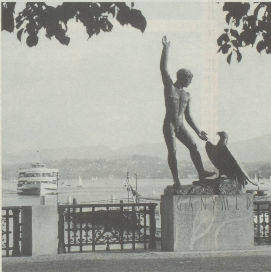
Burkliplatz : A vue effleuré le lac de Zurich jusqu'au Préalpes. Au premier plan, Ganymede, plastique du sculpteur Hermann Hubacher.