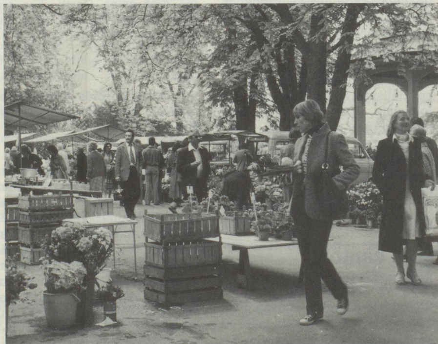
Deux fois par semaine, le marché des fleurs et légumes a lieu à la Bürkliplatz. La ville et la campagne se rencontrent.