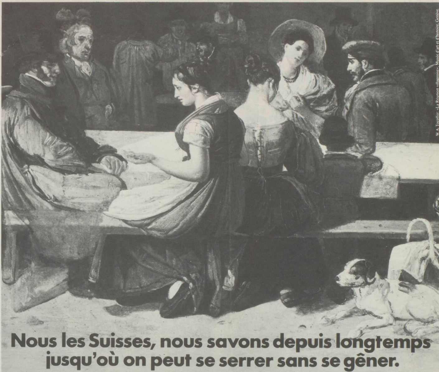
W. A. Toepffer - « La Réunion villageoise » - Musée d'art et d'histoire, Genève.