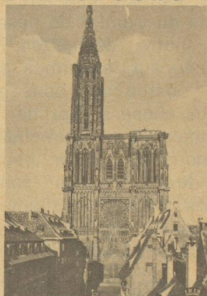
Consulat de Suisse 7, rue Schiller. Tél. : 35-15-17/18.