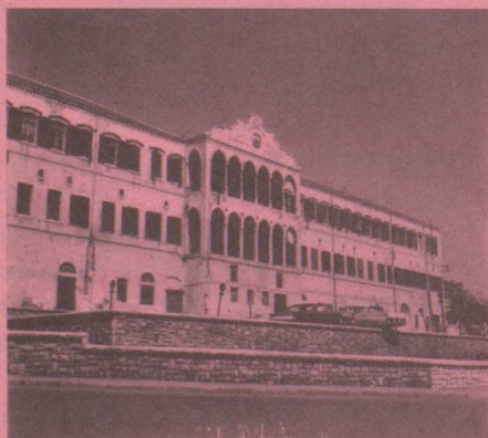
Beyrouth Ambassade, rue John-Kennedy, Immeuble Achou, case postale 172, Beyrouth, de 9 heures à 12 heures du lundi au vendredi. Tél. 366-390/1.