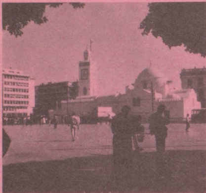
Ambassade , 27 bd Zirout Youcef, de 9 h à 12 h du dimanche au jeudi, Boîte postale 482, Alger-Gare, Algérie.

Communiqué à l'intention des Suisses ayant résidé en Algérie antérieurement au 1 er juillet 1962.