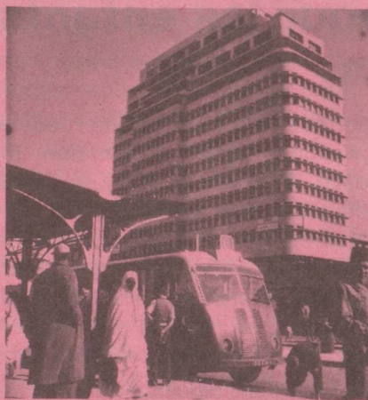
Casablanca Consulat, 79, Mahaj Al Hassan Al-Tani (avenue Hassan II) (De 9 h à 12 h du lundi au vendredi) Case postale 5.