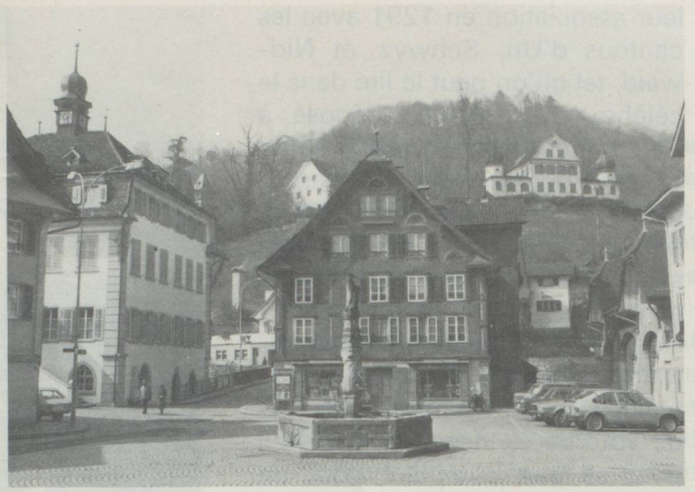
Une place dans le bourg de Sarnen; l'Hôtel de Ville à gauche; sur la colline du Landenberg l'ancien stand de tir

nouveaux cantons n'allât pas sans mal et c'est grâce au message que Nicolas de Flue (1417-1487), ermite retiré à Ranft, adressa à la Diète que les esprits surchauffés se calmèrent et permit l'agrandissement des Etats confédérés ainsi que la disparition du malaise survenu lors des guerres de Bourgogne. En 1981, cet événement sera fêté avec faste. Par contre, si le peuple est sensibilisé, il réagit avec grande vigueur,