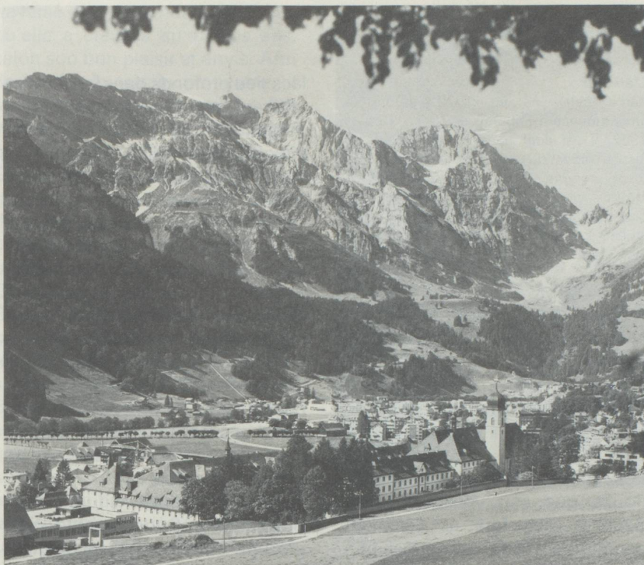
Vue de Sachseln au bord du lac de Sarnen