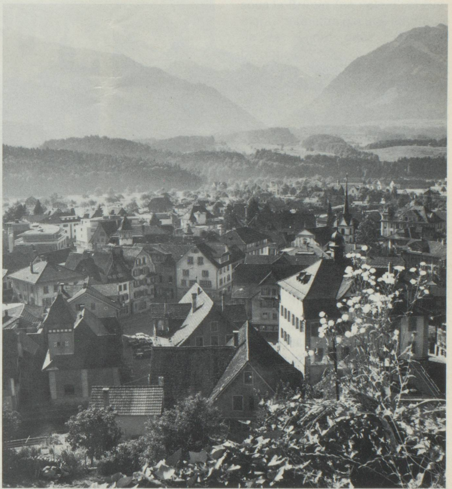
Sarnen, chef-lieu du canton d'Obwald

On constate en regardant l'histoire de la Confédération qu'Obwald a toujours joué un rôle important, participant à toutes les guerres. Les jeunes gens cherchèrent très tôt à faire carrière dans des armées étrangères, même ceux des familles de possédants, car le sol restreint ne pouvait nourrir chacun. Durant la période de la réformation, Obwald resta fidèle à la foi catholique. En 1798 ils subirent le joug imposé à l'Helvétie par Napoléon, tout en restant dans leur cœur fidèles à leurs anciennes alliances comme ils le prouvèrent à la chute de l'empereur. On trouve de nombreux messages de cette