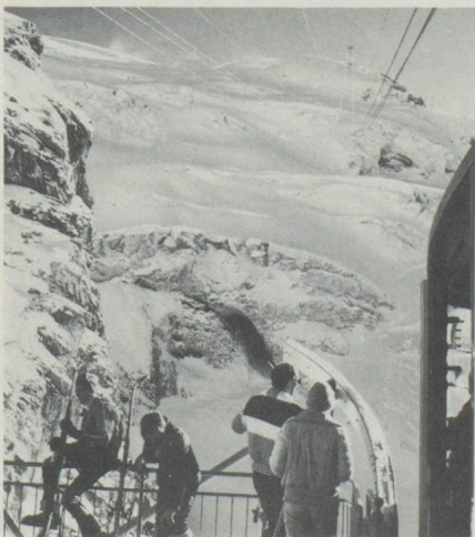
Ski d'été au Titlis au-dessus d'Engelberg

Le caractère de la population a subi d'ailleurs la diversité topographique. A cet effet, il convient de rappeler le Convent de Stans de 1481 qui permit l'entrée dans la Confédération des cantons citadins de Fribourg et Soleure malgré l'opposition des cantons montagnards qui devenaient par là minoritaires. L'acceptation des deux