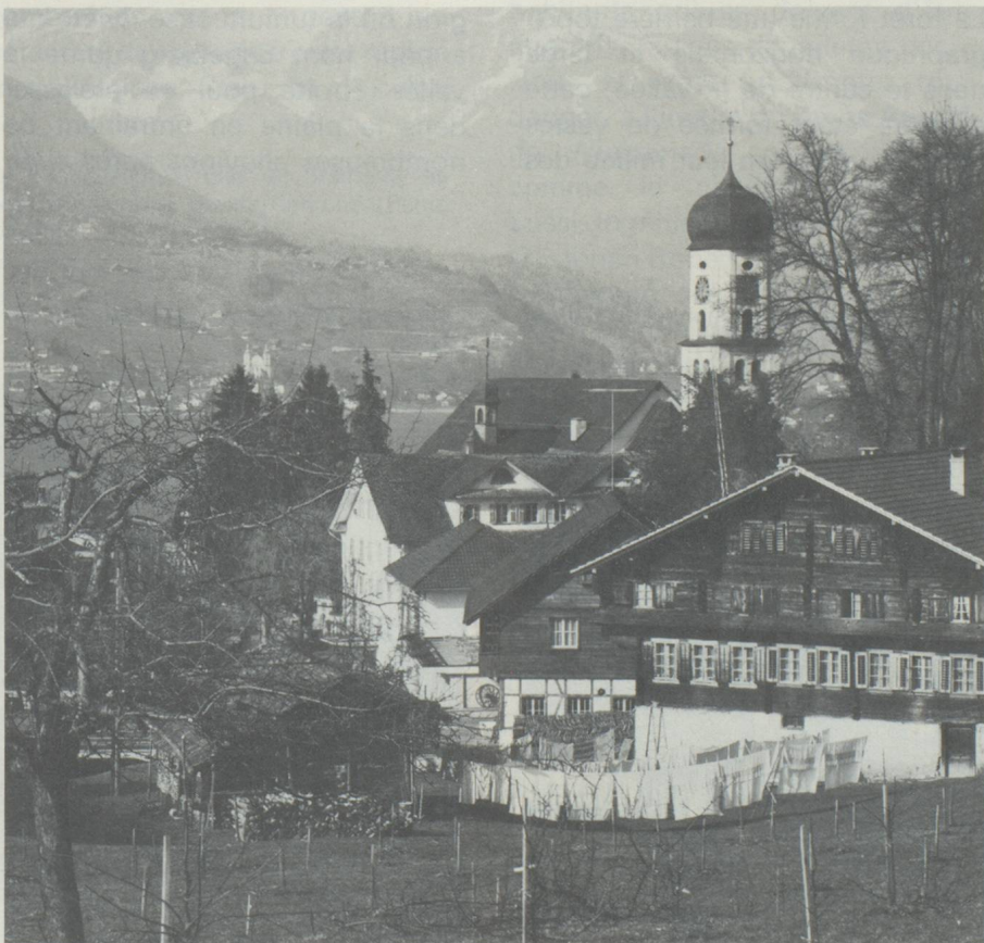
Couvent des Bénédictins à Engelberg, fondé en 1120

sous le Brünig (en voie d'achèvement) permettra par une autoroute de se rendre dans l'Oberland bernois.