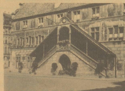
Consulat de Suisse 19 a, rue du Sauvage B. P. 1027 68050 MULHOUSE CEDEX Tél. : (89) 45-32-12