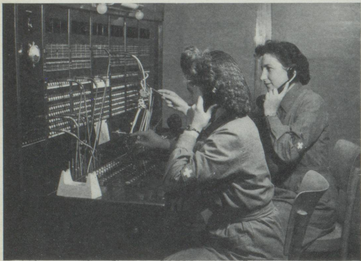
Poste de gué aérien

Le 10 avril 1940, soit il y a 40 ans, le général Guisan créait le service complémentaire féminin de l'armée (S.C.F.). Ce service rappelle le Département militaire fédéral dans un communiqué, constituait un élément nécessaire et important de notre armée. Il a d'ailleurs conservé jusqu'ici la fonction d'une organisation auxiliaire indispensable à l'armée. De 1940 à 1945, le S.C.F. a régulièrement compté de 18 à 23 000 femmes. Après la guerre, les effectifs ont toutefois nettement diminué. On étudie présentement diverses mesures devant permettre un accroissement tant des effectifs que des catégories et services S.C.F.