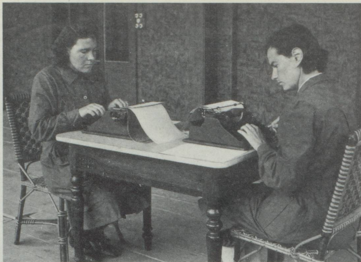
Ordonnances de bureau

bre d'hommes purent être ainsi à nouveau chargés de tâches purement militaires. Pendant le service actif, quelque vingt mille femmes étaient incorporées en permanence dans l'armée. Il fut facile de constater qu'elles s'acquittaient des tâches particulières qui leur étaient confiées bien souvent mieux que les hommes.