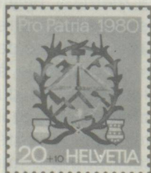
Maçon et charpentier