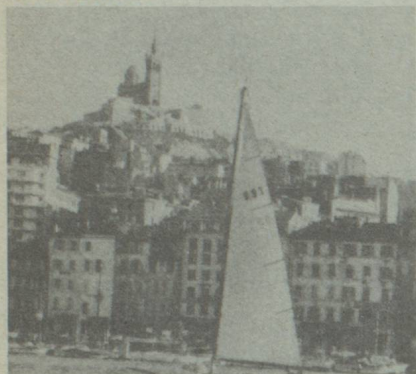
Consulat général 7, rue d'Arcole Tél. : (91) 53-36-65