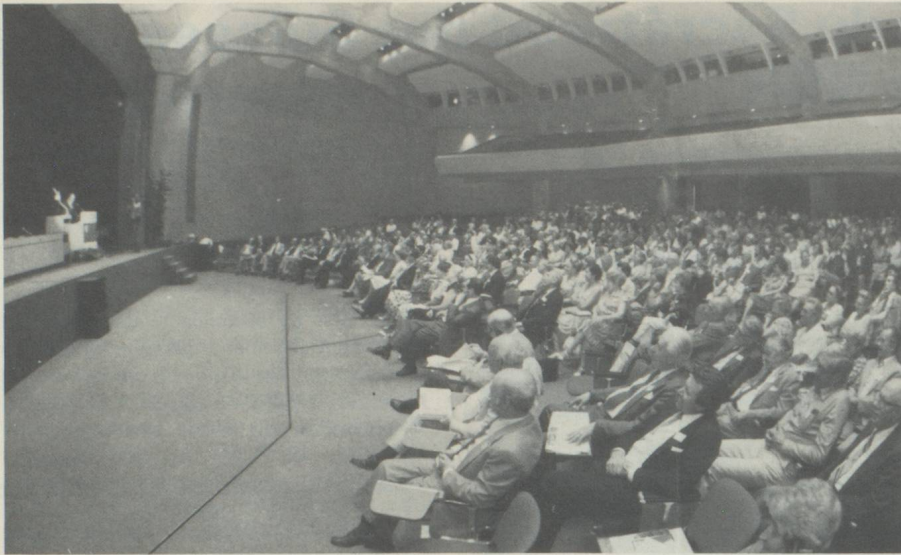
Durant l'assemblée plénière