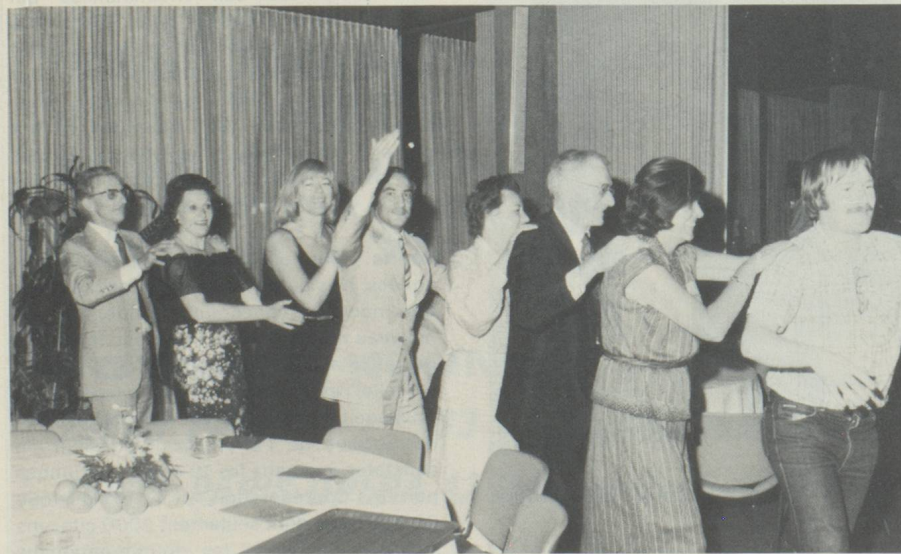
En avant pour une «Polonaise»

(Suisse et une nationalité étrangère) et les enfants dont la nationalité de la mère est suisse. D'autre part, les cours sont donnés en langue allemande à l'exception de 2 instituts. Pratiquement, cela signifie que la Confédération a l'intention d'appliquer la loi à la lettre, à savoir que seules les écoles dont le nombre d'élèves suisses atteint au moins 30% peuvent être déclarées: «Ecoles suisses», ce qui risque de mettre les écoles suivantes dans une situation difficile: Bogota, Florence, Gênes et Naples. Le rôle culturel des écoles suisses de l'étranger est trouvé très faible par les autorités fédérales qui estiment qu'à l'avenir la formation des jeunes Suisses de l'étranger devrait être la tâche d'organisations privées ou publiques touchant l'économie.