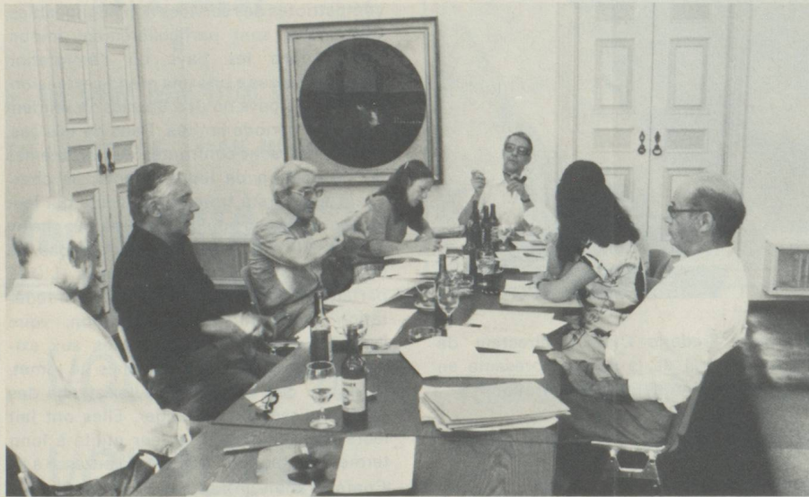
Séance du comité du Fonds de solidarité