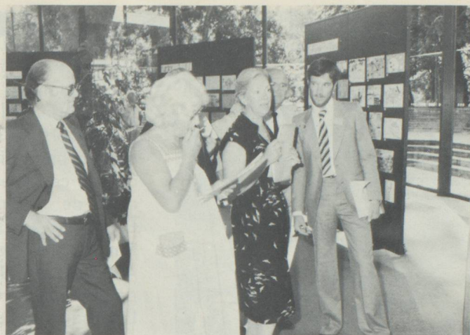
Le jury spécial en pleine action

intéressés en leur indiquant que la Confédération désirait obtenir un dialogue et trouver une solution pour chaque cas.