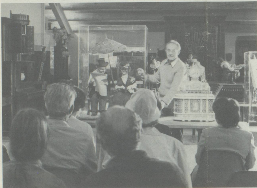
Automate construit par H. Vichy, Paris, 1861. Le vieux couple est rappelé à la vie.

A Seewen, commune paysanne dans la partie nord du canton de Soleure, au nord-ouest de la Suisse, des boîtes à musique, des orgues de Barbarie et des pianos mécaniques reviennent à la vie dans la collection d'automates musicaux. D'anciens orgues de Barbarie égrènent une valse, l'orgue-secrétaire du Comte Esterhazy joue Haydn, des mélodies de Mozart émanent de l'orgue à flûte traversière, de petits oiseaux gazouillent dans des arbres fantaisie, des horloges illustrées avancent au gré de la musique, un