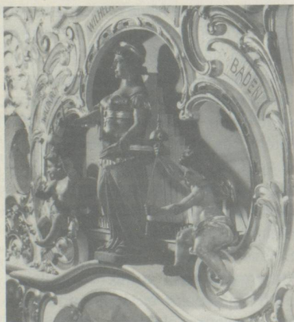
Grand orgue forain de Wilhelm Bruder fils, Waldkirch. Début du XX e siècle.

Ce monde féérique des sons est ouvert au public de 14 à 17 heures, du mardi au samedi, depuis le 1 er mars jusqu'à mi-décembre. Visites commentées sur demande pour des groupes.