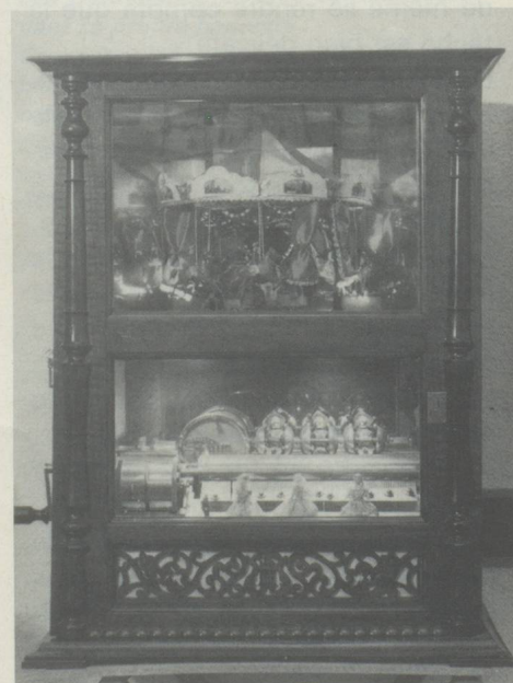
Boîte à musique d'Auguste Lassueur, St Croix, vers 1880. Cet automate se trouvait jusqu'en 1918 dans la salle d'attente de la gare de Sissach.

EDITEUR : FEDERATION DES SOCIETES SUISSES DE PARIS - DIRECTRICE DE LA PUBLICATION : Nelly SILVAGNI-SCHENK SIEGE SOCIAL : 11, rue Paul Louis Courier 75007 Paris, Tél : 544.68.41 - C.C.P. Messenger Suisse 12273-27 Paris - Prix de l'abonnement : 70 F, Etranger : 75 F IMPRIMEUR : TSCHUMI - TAUPIN, 24 rue de Dammarie 77000 MELUN - Dépôt légal : 1 er trimestre 1981 - N° 1 (Commission paritaire n° 52679)