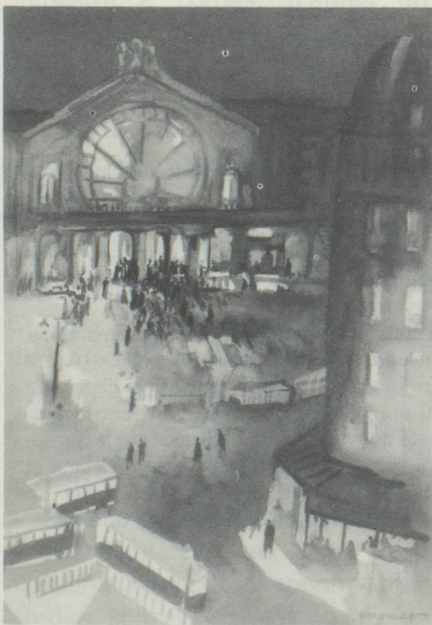
« Gare de l'Est », aquarelle, U. Wagner

J. Walter Thompson 22, avenue Matignon 75008 Paris