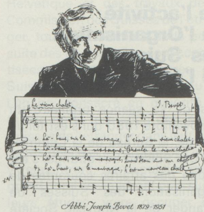
Abbé Joseph Bovet, 1879-1951