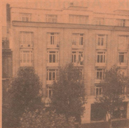
CONSULAT : 124, boulevard de Strasbourg Tél. : (35) 42.27.09