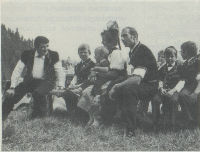
Jeunes et vieux prennent plaisir à cette fête alpestre.