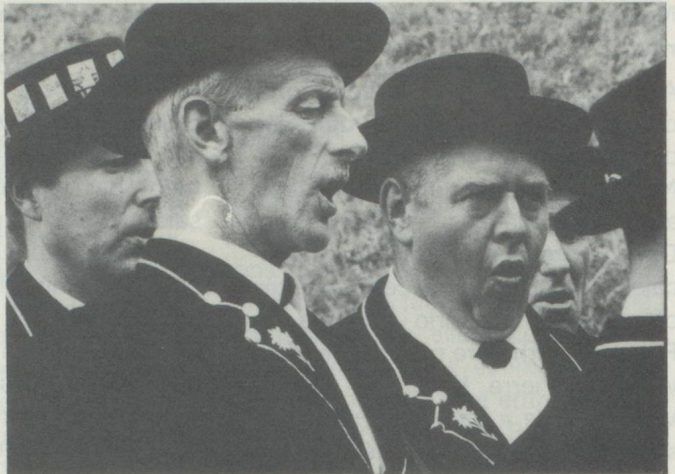
Les jodleurs égaient la commune en fête de leurs chants.