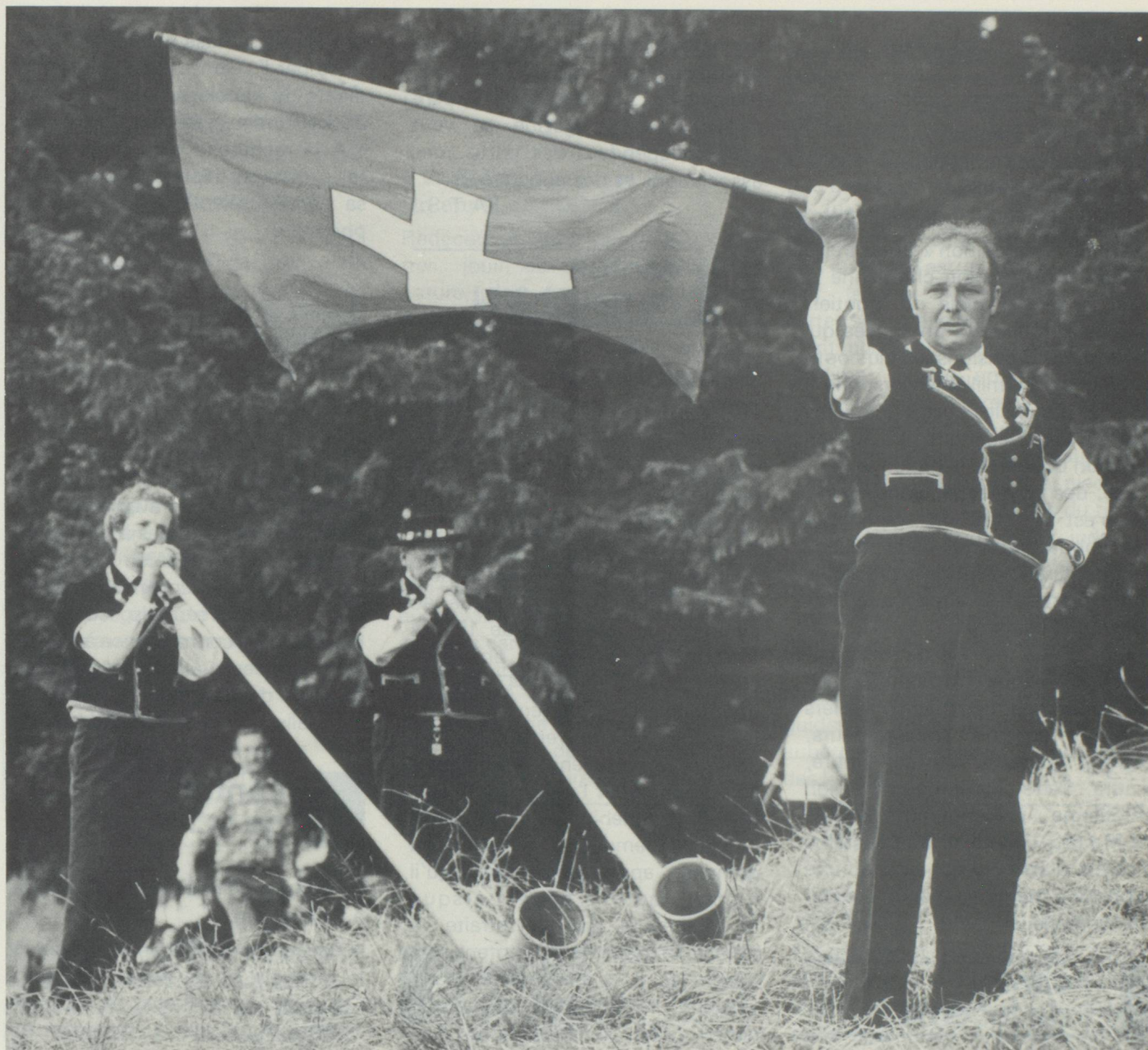
Joueurs de cor des alpes et lanceurs de drapeaux font partie de la fête.

Le deuxième dimanche d'août, bon nombre de Confédérés, avides de plaisir, venant de loin et de près, montent à la Lüdern dans le massif du Napf en Emmental. Ils arrivent en voiture, en car postal ou même à pied dans cette magnifique région pédestre. La Lüdern passe pour le lieu d'origine de la production du fromage d'Emmental, déplacé ensuite dans la vallée. A dix heures, les lutteurs commencent le premier round. « Hopp Sepp », les spectateurs encouragent leur ami dans l'arène. La sciure jaillit, la lutte est acharnée. Une foule s'est déjà réunie pour le traditionnel prêche sur l'alpe de 11 heures.