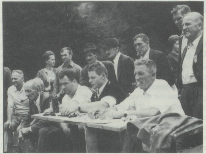
Le jury sévère surveille la lutte d'un œil exercé et les spectateurs ne sont pas moins intéressés.