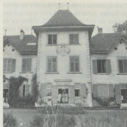
Vue du Château de Waldegg