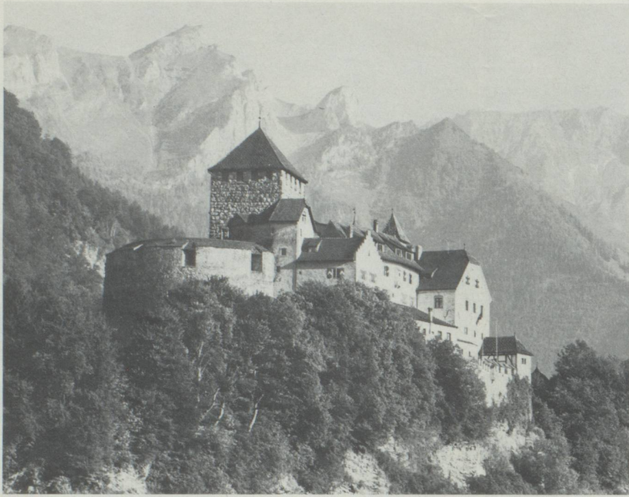
Le Château de Vaduz

traces toujours visibles sur notre territoire. Venant de l'ouest et du nord-ouest, elles ne furent point connues plus à l'est. Grâce à des recherches, il est aisé de suivre l'évolution de l'âge du bronze dans la partie supérieure de la vallée du Rhin. On constate même à l'âge avancé du bronze, le développement d'une culture propre dans la région des Alpes, connue sous la dénomination de «Melauner-Kultur», dont le rayonnement s'étendit à la partie ouest du territoire. Très certainement, les objets de cette culture, dont toute la région fut dotée, et qui sont par ailleurs difficilement définissables, feront toujours défaut. Une continuité dans l'habitat du territoire du Liechtenstein a pu être prouvée par l'archéologie pour les différentes phases de l'âge du fer. De l'époque étrusque reculée (env. 500-15 av. J.-C.) on a découvert à plusieurs reprises une spécialité de céramique dite d'Eschnerberg, à laquelle les ouvrages d'étude touchant l'archéologie ont attribué la mention de: «céramique rapide». Il convient encore de signaler les