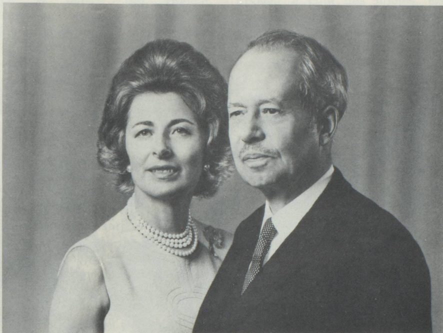
Le Prince et la Princesse de Liechtenstein

Pour Aristote, les frontières d'un état sont d'essence autarcique dans l'ensemble des domaines comme il aime à le souligner par cette parole: «Pour la pleine satisfaction de la vie.» La technologie moderne, ainsi que le monde civilisé, ont rendu fort relative la notion d'autarchie. En lieu et place, la dépendance s'est instaurée que l'on se plaît à nommer interdépendance. L'évolution met en danger le petit état, mais ne le tue point. Force de persuasion et fantaisie sont ses attributs de prédilection qui servent d'ailleurs aujourd'hui de modèle pour le monde. Citons le dramaturge moderne Friedrich Dürrenmatt: «...Je peux me représenter un écrivain; un écrivain qui a un plaisir incommensurable d'être du Liechtenstein, et seulement du Liechtenstein, pour qui le Liechtenstein représente beaucoup plus que les 61 kilomètres carrés de sa surface effective. Pour cet écrivain, le Liechtenstein est le modèle d'un monde en devenir qui va prendre forme et se répandre, faisant de Vaduz une Babylone, et pourquoi pas du prince, un Nabuchodonosor. Le peuple du Liechtenstein protestera certainement, criant à l'exagération, à l'abandon du folklore régional et de la production du fromage. Mais cet écrivain ne sera pas seulement représenté à Saint-Gall, son audience deviendra internationale, car le monde se reconnaîtra dans la découverte de son Liechtenstein. Cet écrivain du