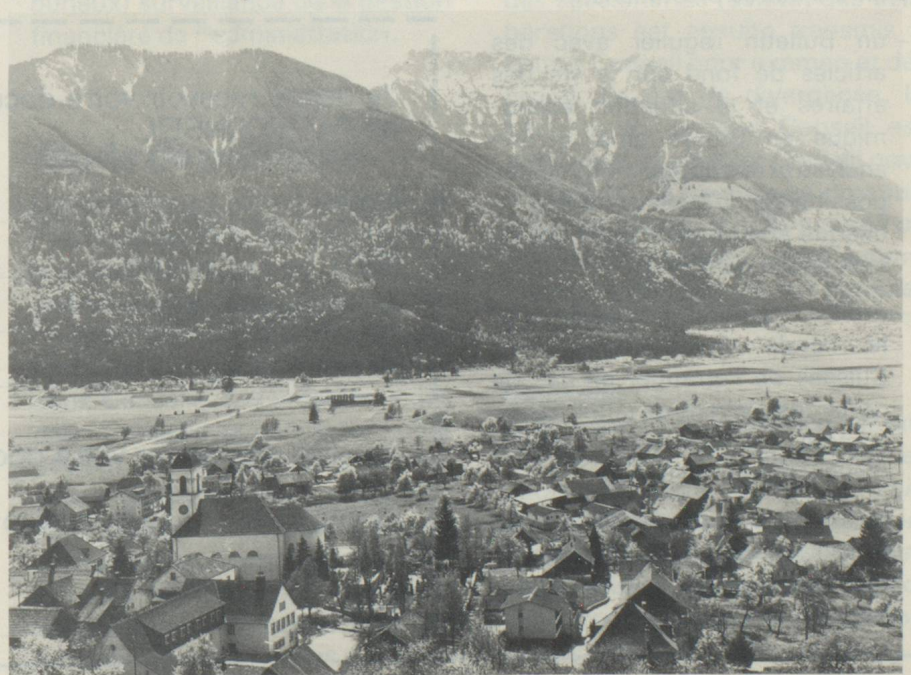
Le Liechtenstein se distingue par son paysage varié...