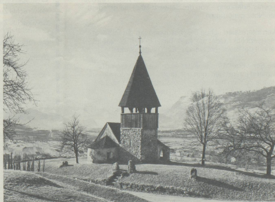
La chapelle de Triesenberg

trouvait à côté des nobles, les couvents de Saint-Gall et de Weingarten. De son côté la famille princière du Liechtenstein fit également des offres. Il est possible de suivre l'évolution de la noblesse du Liechtenstein dès le 12 e siècle, dont l'influence à la cour de Vienne trouva son apogée au cours des 16 e et 17 e siècles. Malgré la possession et l'acquisition de territoires étendus, elle ne put prétendre à une voix et à un siège de grand électeur auprès du Saint empire romain germanique, car l'ensemble des contrées sous sa juridiction étaient trop éparpillées. Afin d'y parvenir, Jean Adam André du Liechtenstein, prince, grand mécène de l'art baroque et régisseur de talent, regroupa pour son compte la seigneurie de Schellenberg en 1699 et le comté de Vaduz en 1712. L'empereur Charles VI assembla en 1719, les deux provinces, créant une principauté impériale portant le nom de Liechtenstein (343 e membre du Saint empire romain germanique). Il en résulta, à l'intérieur du pays une plus grande rigueur administrative de type despotique, basée sur le droit divin. L'ancienne chartre fut supprimée,