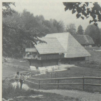
Grange à trois étages de Kiesen (Berne), édifée avec des demi-poutres. On voit en second plan la maison de Madiswil (plateau du Mittelland bernois) de 1710 : sous le même toit, logements jumelés avec cuisine commune.