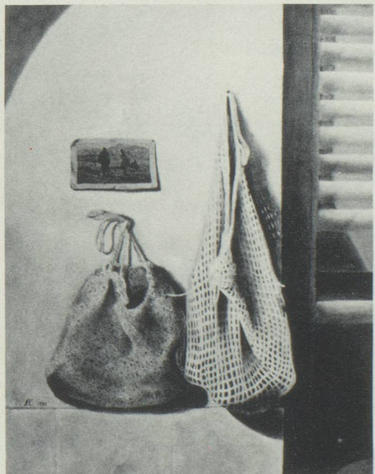
Norbert Clément «L'Angélus» (Pérou)