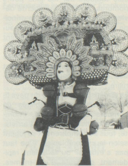
La St-Sylvestre du calendrier Julien à Urnäsch.