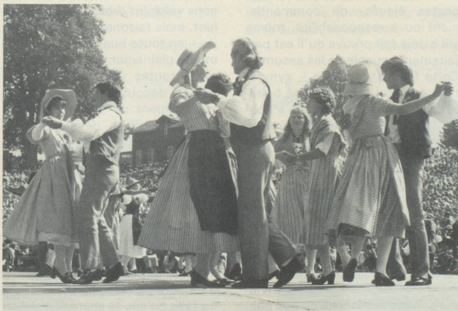
La danse populaire est encore très vivace en Suisse.

Cette situation a des effets paralysants autant sur le plan politique que professionnel. Si la consultation mutuelle forme la base de