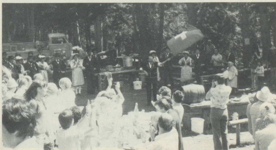
Un groupe folklorique agrémenté l'excursion du dimanche.

L'après-midi fut consacré à divers problèmes et avant tout au message du Conseiller fédéral Aubert qui rendit son auditoire attentif au travail de son Département, actuellement préoccupé par les relations de la Suisse avec l'ONU. Il défendit la thèse de l'interdépendance internationale toujours croissante, à laquelle la Suisse ne peut se soustraire, son adhésion à l'ONU s'avère nécessaire dans le cadre de la politique extérieure traditionnelle et pragmatique. Au début, les relations extérieures de