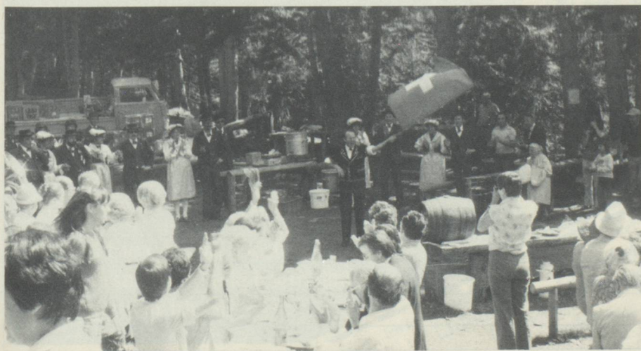
Un groupe folklorique agrémenté l'excursion du dimanche.

L'après-midi fut consacré à divers problèmes et avant tout au message du Conseiller fédéral Aubert qui rendit son auditoire attentif au travail de son Département, actuellement préoccupé par les relations de la Suisse avec l'ONU. Il défendit la thèse de l'interdépendance internationale toujours croissante, à laquelle la Suisse ne peut se soustraire, son adhésion à l'ONU s'avère nécessaire dans le cadre de la politique extérieure traditionnelle et pragmatique. Au début, les relations extérieures de