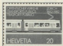
20 c. Centenaire du tramway à Zurich

Suisse Timbres-poste spéciaux II 1982 Jour d'émission 23 8 1982