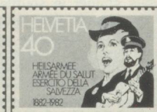
40 c. Schweiz Centenaire de l'Armée du Salut en Suisse