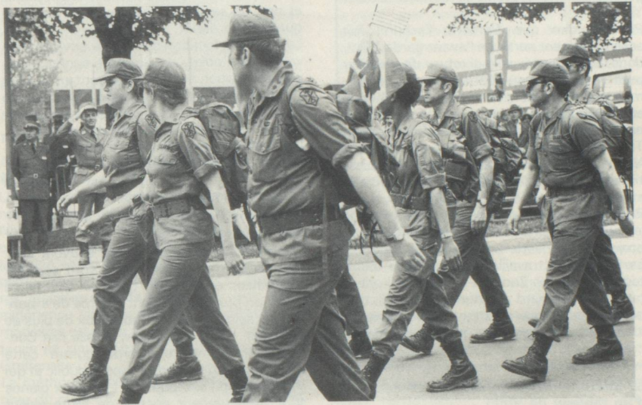
L'armée US participe à la marche de deux jours.