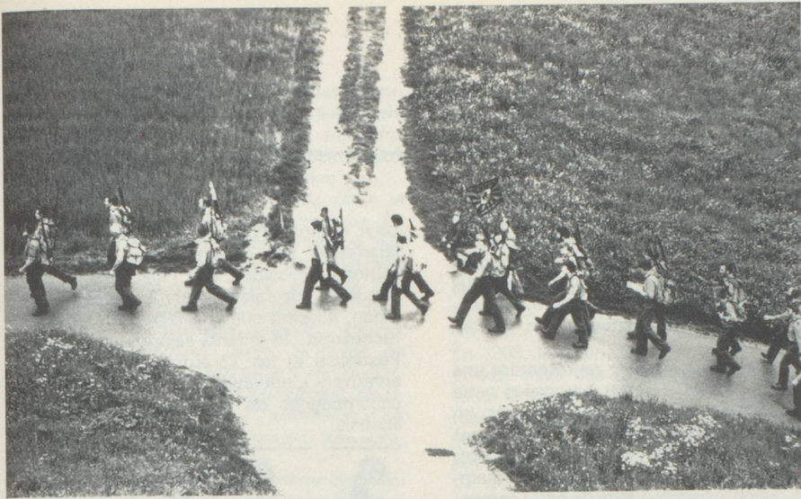
L'ours de Berne, fait lui aussi sa randonnée printanière.