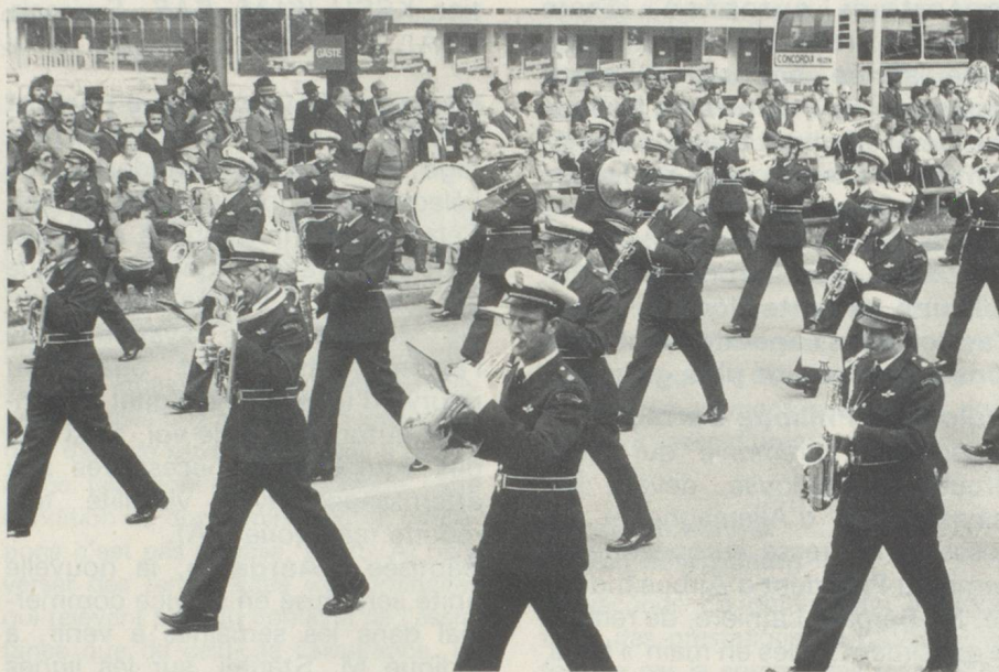
Une des fanfares encourageant les participants à cette marche de deux jours par un air entraînant.

vaut la peine de réserver le week-end des 14 et 15 mai 1983 pour un voyage à Berne.