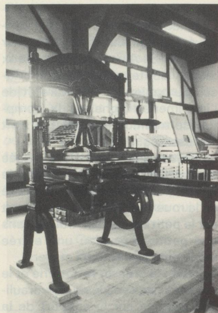
Presse typographique, 1865.

C'est pourquoi l'on y trouve également, outre une bibliothèque spécialisée, des archives photographiques dotées d'une série de films documentaires. Nul doute que le moulin à papier de Bâle, carrefour des amis de l'histoire culturelle, de l'artisanat et, surtout, du beau livre, représente bien plus qu'un simple joyau architectural ornant la ville de Bâle.