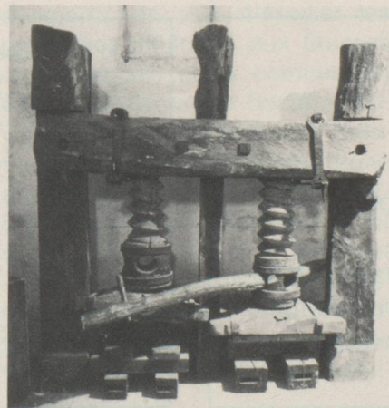
Presse à papier, environ 1500 après J. C.