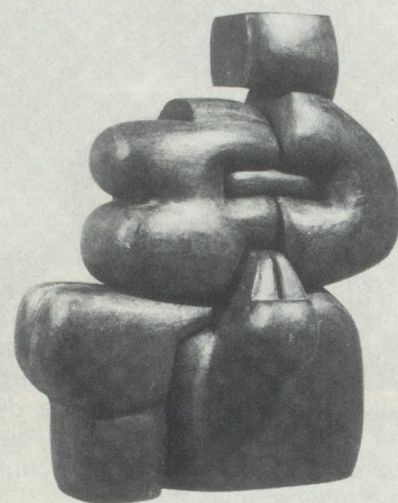
« L'espace l'a sculpté » 1980 bois teinté hauteur 60 cm.

de chaque élément se doit donc d'être particulièrement rigoureux. Ces formes abstraites, mais évo- quant un arrière plan naturaliste, gonflées d'instinct vital, ne sont pas sans rappeler l'art totémique des peuplades primitives où tout est signe. Il n'y a rien de l'esthète chez M. Perrenoud, aucune concession aux modes périssables mais, tra- duite par un métier sûr et précis, une sincérité totale dans l'expres- sion plastique doublée d'un goût ludique aisément discernable.