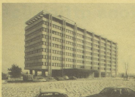
Caisse de compensation à Genève.

H. G. Le nouveau système est déjà appliqué dans près de 50% des cas. Nous admettons des exceptions là où les transferts de devises sont soumis à de fortes restrictions, s'il s'avère possible d'effectuer des compensations entre les cotisations et les rentes. Si nécessaire, nous nous efforçons aussi de trouver des solutions pragmatiques; c'est ainsi qu'en Italie tous les cotisants font leurs versements sur un seul