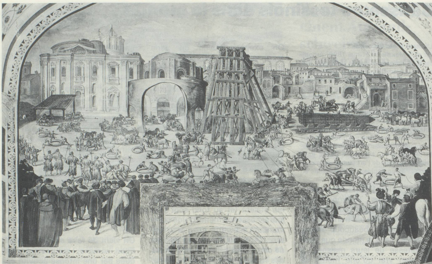
Fresque se trouvant à la bibliothèque vaticane, rappelant les travaux d'érection de l'obélisque.

œuvres jamais égalées en Russie et à Milan.