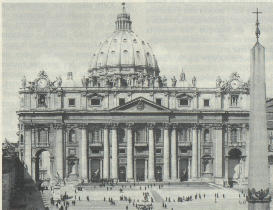
Façade de la basilique Saint-Pierre, à droite le célèbre obélisque

On vient de faire allusion à la période romane, qui restera marquée par une intense activité des Tessinois, en Italie et ailleurs. Une autre période tout aussi fructueuse se situe entre la fin du XVI e siècle et la moitié du XVII e , surtout à Rome, précédant l'ère néo-classique, qui s'est concrétisée par des