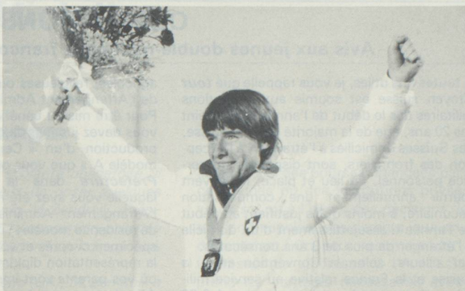
Max Julen, premier médaillé suisse des Jeux d'hiver. Il a gagné la médaille d'or en slalom géant masculin.